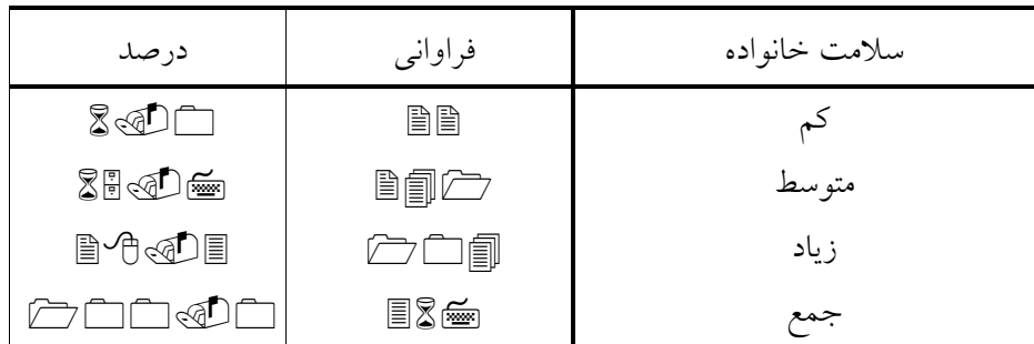
جدول ۳- توزیع فراوانی و درصدی شاخص کل سلامت خانواده پاسخگویان

بر اساس جدول ۳، ۲۲ نفر و یا ۶ درصد از خانواده‌های نمونه ما از سلامت خانواده در حد ضعیف برخوردارند، که درصد قابل قبولی به نظر می‌رسد. بیشترین فراوانی مربوط به حد متوسط است، بطوری که حدود ۶۶ درصد که شامل ۲۴۱ خانواده می‌باشد در این محدوده قرار می‌گیرند. ۱۰۴ نفر و یا ۲۸ درصد دارای وضعیت سلامت خانوادگی در حد زیاد هستند. احتمالاً خانواده‌هایی که از حد سلامت ضعیف برخوردارند، آنهایی هستند که دچار بحران‌های جدی بوده و احتمال فروپاشی آنها وجود دارد. با توجه به این که تنها ۲۸ درصد خانواده‌های تهرانی در سطح سلامتی بالا هستند، نشان دهنده هشدار است که باید به آن توجه کرد.