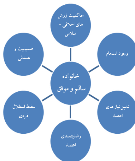
نمودار ۱- نمودار مولفه‌های سلامت خانواده

اساس سلامت خانواده دانست. با توجه به مطالب یاد شده می‌توان نمودار زیر را برای مولفه‌های سلامت خانواده مطرح کرد: