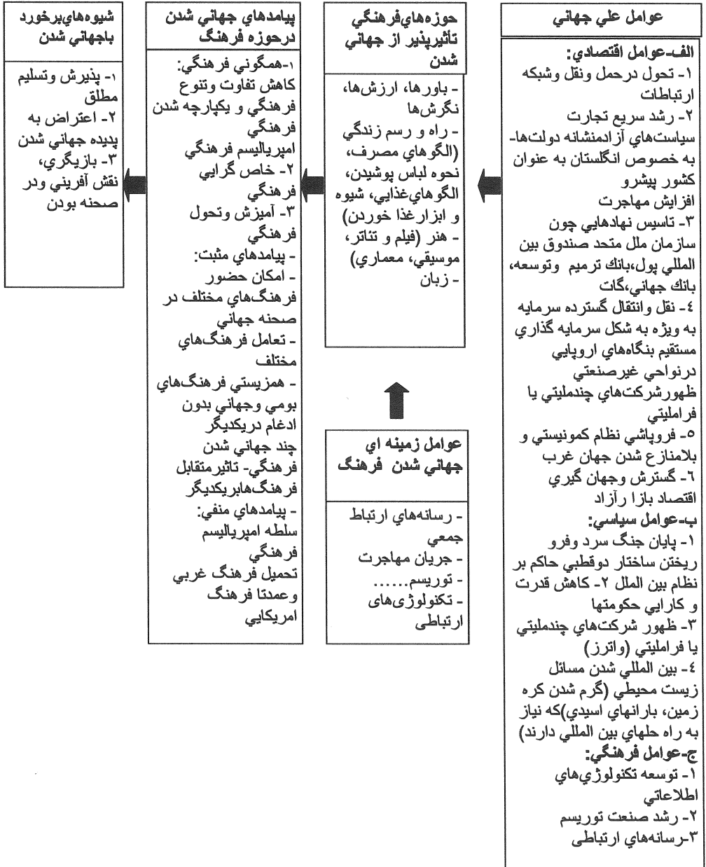
شکل ۱- مدل جامع جهانی شدن