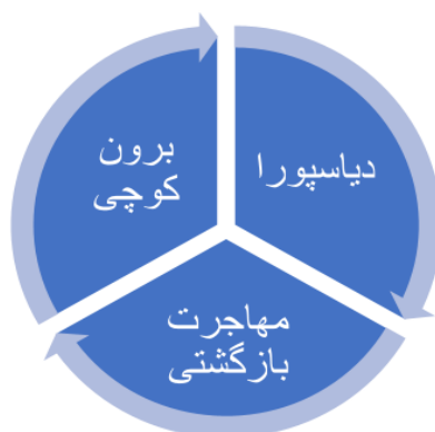
شکل ۱: چرخه تحرک مکانی

تحرک مکانی افراد صبغه‌ای به دیرینه خلق بشر دارد و جماعت‌های انسانی همواره به دلایل متنوعی همچون دستیابی به معاش، امنیت و آینده‌ای بهتر چه در داخل مرزهای ملی و چه به دلیل توسعه و سهولت حمل‌ونقل و ارتباطات، در ورای مرزهای جغرافیایی به مهاجرت دست‌زده‌اند. مهاجرت همواره یک جز مهم شهرنشینی، توسعه اقتصادی، تغییرات اجتماعی و سازمان سیاسی بوده و به تغییر پایگاه، شغل و موقعیت مکانی افراد می‌انجامد و روند آن در سال‌های اخیر به صورت پرشتابی افزایش یافته است. مهاجر بین‌المللی به فردی اطلاق می‌گردد که بیش از یک سال در کشوری غیر از کشور محل اقامت خود اسکان داشته باشد که تعداد مهاجران با رشدی شتابان به ۲۷۲ میلیون نفر در سال ۲۰۱۹ رسیده است. در ادبیات نوین مهاجرت از "چرخه تحرک مکانی" ۱ یاد می‌شود که حرکت جمعیت‌های انسانی را یک فرایند چندوجهی دانسته که می‌توان آن را در سه فاز مورد تحلیل قرارداد که در شکل زیر آورده شده است: