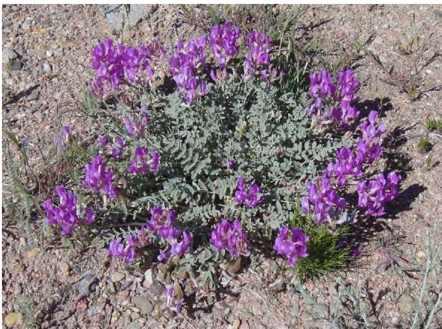
تصویر ۳- نمایی از بوته باجگاه که مرغوبترین نوع کتیرا از آن تهیه می‌شود.

۱. بوته باجگاه * ۲. پشمک * ۳. گُمپ * ۴. زهروک که تنها همین بوته در کوهمره جروق به گون معروف بود. * ۵. چراغ. ۶. شَدَه * ۷. ژول که در اصطلاح محلی به خار توسک معروف بود.