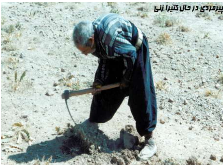
تصویر ۱- پیرمردی با سابقه طولانی در کتیرا زنی

سلول‌های پارانشیمی با جذب آن به تدریج به صمغ تبدیل می‌شود. فشار تولید شده سبب رانده شدن صمغ به طرف شکاف می‌گردد. صمغ در مجاورت هوا در اثر تبخیر آب به تدریج سخت می‌گردد و به شکل محصول خشک شده، بسته به نوع شکافی که بر روی ساقه ایجاد شده است در می‌آید. بنابر تحقیقات صورت گرفته، در ایران حدود پانصد گونه گون یا مول کتیرا به عمل می‌آید و در هر نقطه‌ای از ایران نوع خاصی از کتیرا می‌روید. کتیرا به رنگ سفید، زرد، قهوه‌ای کم رنگ و پر رنگ دیده می‌شود. روش‌های به دست آوردن کتیرا گوناگون است. در همه این روش‌ها معمولاً سه نوع کتیرا به دست می‌آید که عبارتند از: ورقه‌ای، معولی و مفتولی. کتیرای ورقه‌ای از تیغ زدن ساقه به دست می‌آید، کتیرای مفتولی را از فرو بردن سیخ یا میخی در ساقه به دست می‌آورند و کتیرای معمولی که چندان مرغوب نیست به شکل لوله یا مدورات و از تیغ زدن به دست می‌آید. قسمت عمده کتیرای ایران از نوع ورقه‌ای است.