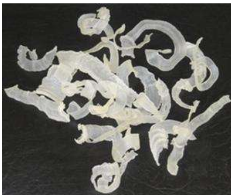
تصویر ۳- نمایی از کتیرای مرغوب معروف به شاخ قوچی