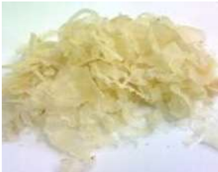
تصویر ۲- نمایی از کتیرای مرغوب