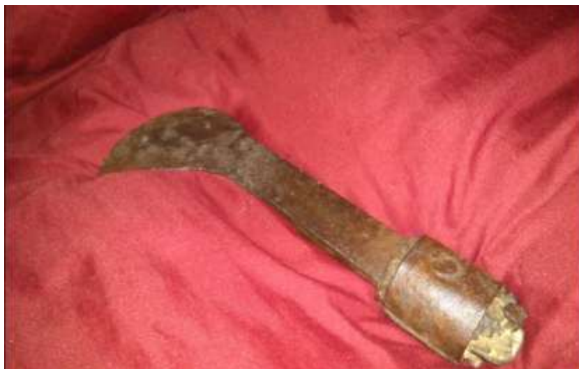
تصویر ۴- نمایی از تیغ کتیرا زنی

تیغ: تیغ‌های فلزی از جنس آهن است که قسمت بالایی آن قوسی شکل است و در قسمت انتهایی آن سوراخی وجود دارد که چوبی به طول تقریبی یک متر در آن تعبیه شده است. این چوب معمولاً از جنس درخت آهر یا ارژن تهیه می‌شد که بسیار بادوام بود.